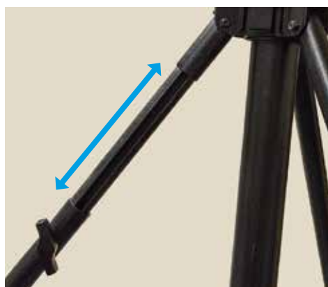
Säädettävät jalat epätasaiseen maastoon