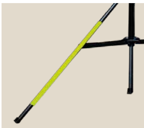
Jalustan jaloissa olevat heijastimet tuovat lisäturvaa