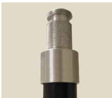
Universaali DIN-tappiliitin (30 mm DIN 14640)