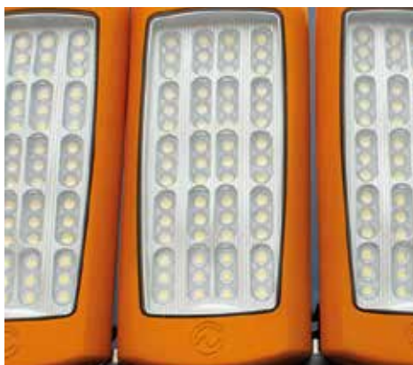
Suojausluokka IP67, lujatekoinen, iskunkestävä kotelo