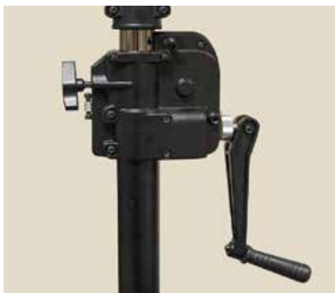
Lujatekoinen alumiini-teräsjalusta käsivivillä ja turvalukolla