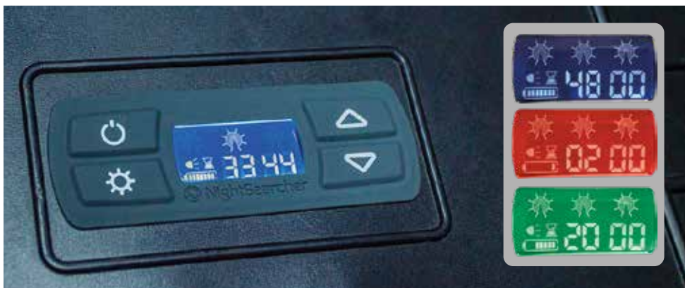
Ohjelmoitava LCD-näyttö: Valotilan valinta • Ohjelmoitava toiminta-aika, jopa 48 tuntia • Akun varaustaso näkyy väreinä